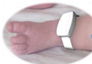
Tag actif ou passif