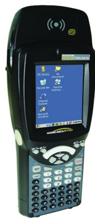
Terminaux, antennes RFID